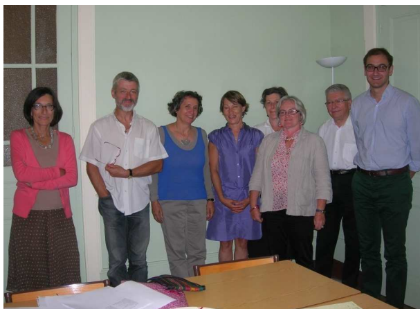
EAP : la nouvelle équipe

* L.e.M.E. : Laïcs en Mission Ecclésiale