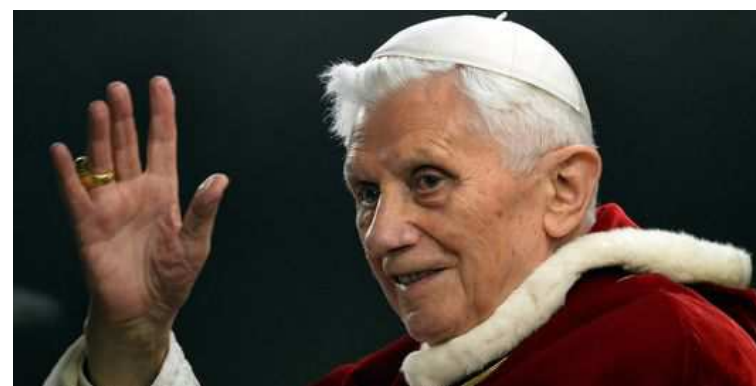
Benoît XVI, le 29 décembre.

Extrait du site internet du diocèse de Lyon ( http://lyon.catholique.fr )