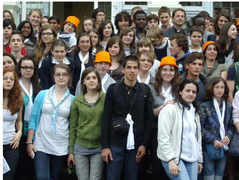
Les jeunes de l'aumônerie du groupe 4 e / 3 e et Mgr Thierry Brac de la Perrière