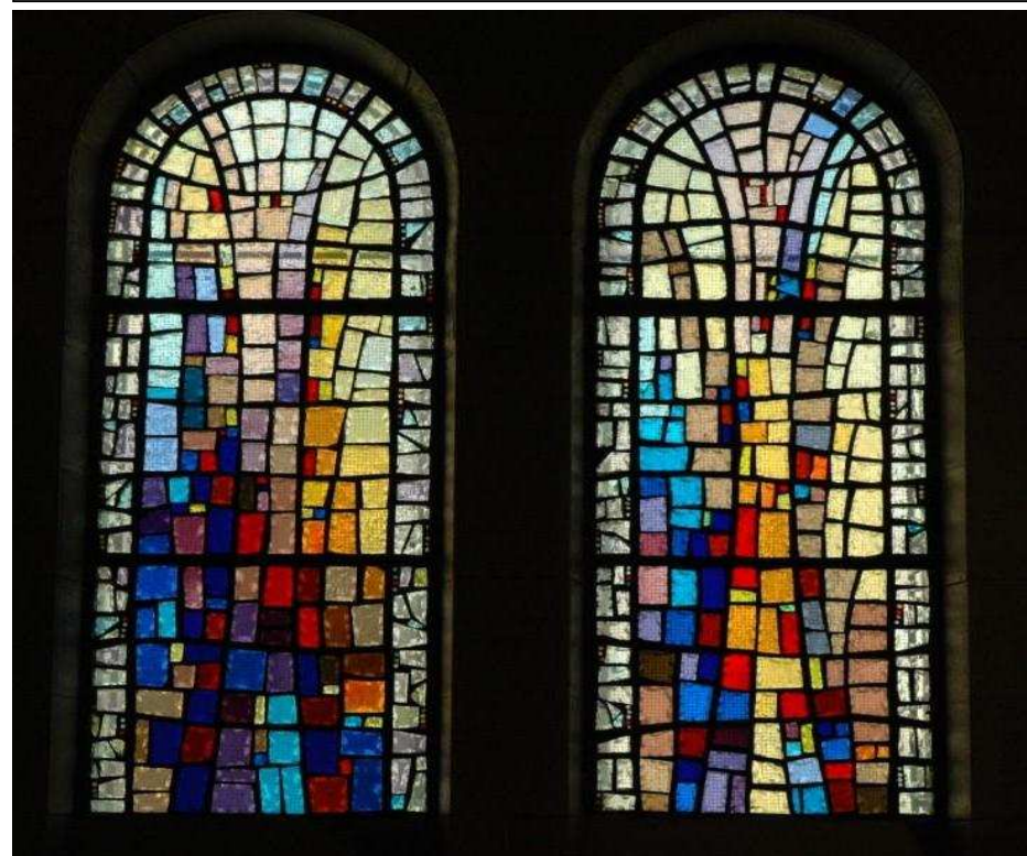
Vitraux de la Chapelle Sainte Anne