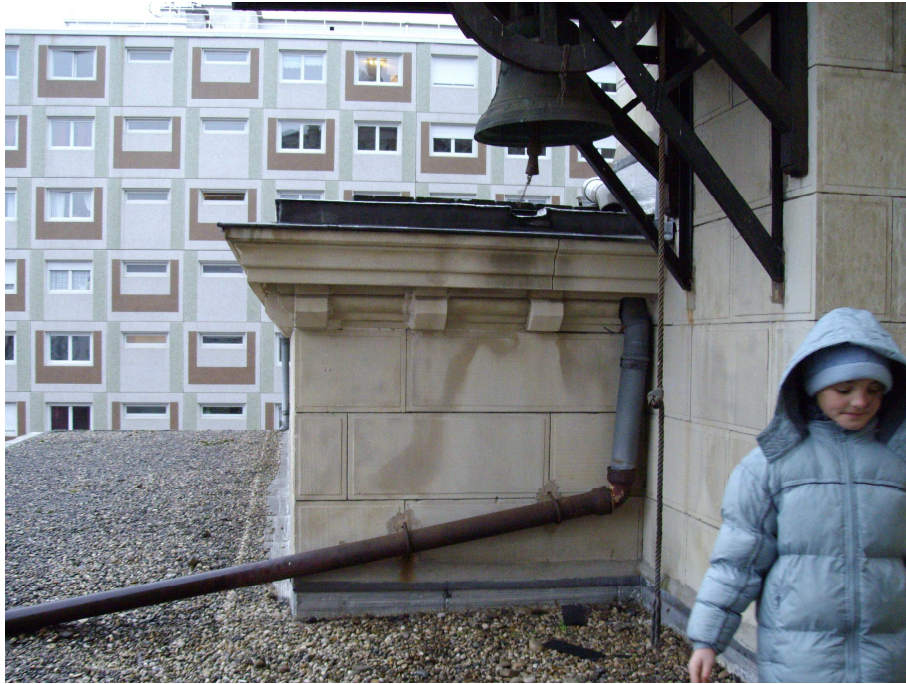
"La cloche sans clocher "