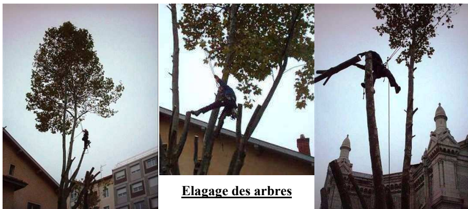
Elagage des arbres