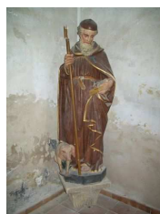
Saint Antoine et son cochon